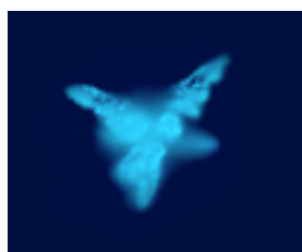
Workshop Gubbio 2016

Sentiremo i diversi livelli del paesaggio e il ruolo di Lugano quale mediatore tra le forze creative della penisola appenninica ed il mondo sotterraneo del dorso del drago delle Alpi.